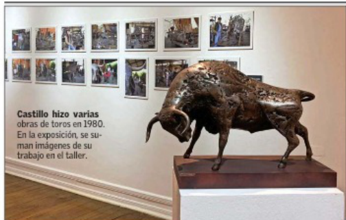
Castillo hizo varias obras de toros en 1980. En la exposición, se suman imágenes de su trabajo en el taller.