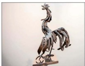
"Gallo", 1979. En la muestra, las obras se ordenan de acuerdo a su temática: animales, erótico, religioso, político y piezas abstractas.