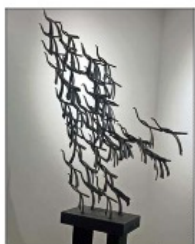
Maqueta del monumento de acero de 9 metros a Martin Luther King, de 1975, en la U. de Boston.

"Nos llena de orgullo poder llevar al público esta muestra con piezas tan sobresalientes del patrimonio escultórico nacional, tal como lo es la monumental obra 'Erupción' que se